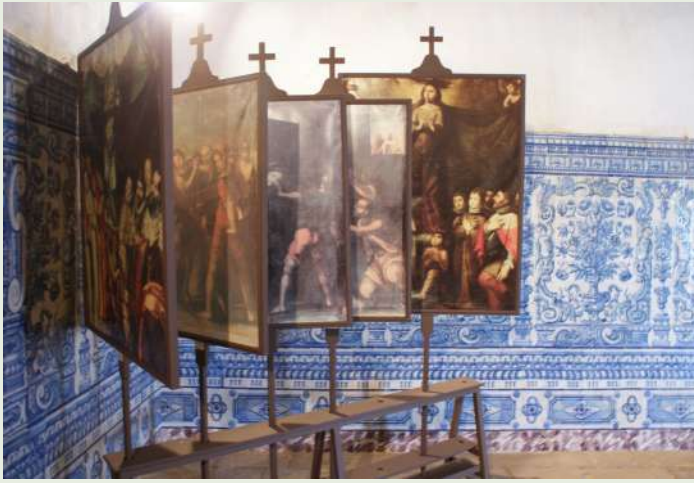
Replicas dos Painéis expostos na Igreja da Misericórdia

A Santa Casa da Misericórdia prepara-se para dar um passo fundamental na valorização e conservação do seu notável património histórico-artístico. A Mesa Administrativa tem como ambicioso objetivo expor as bandeiras e os painéis originais da Misericórdia no interior da Igreja de Santa Maria da Caridade. Estas peças, que em tempos gloriosos marcavam presença na tradicional Procissão do Senhor da Misericórdia/Fogaréus, serão assim acessíveis ao público, numa iniciativa que visa não só proteger estas relíquias, mas também reforçar o interesse pela igreja e pela própria Misericórdia.