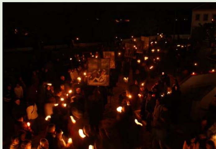
Procissão do Sr. da Misericórdia/ Fogaréus

da Misericórdia/Fogaréus, garantindo que a secular tradição se mantém viva e visível para as novas gerações, sem, no entanto, colocar em risco a integridade do património original.