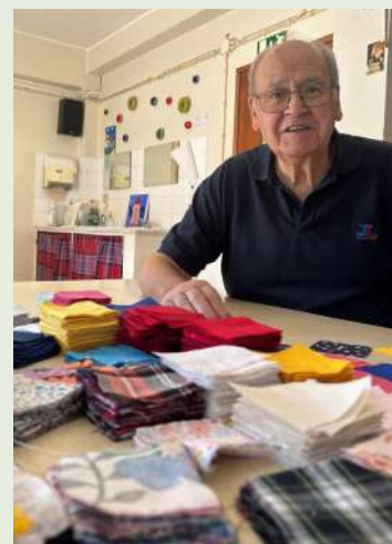
A preparar os tecidos para os "sacos de retalhos"

Ele é um verdadeiro artesão, cujo legado não se limita apenas aos estofos que criou, mas também às memórias e à paixão que partilhou com aqueles que o rodearam.