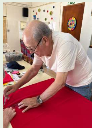
A "talhar tecido"